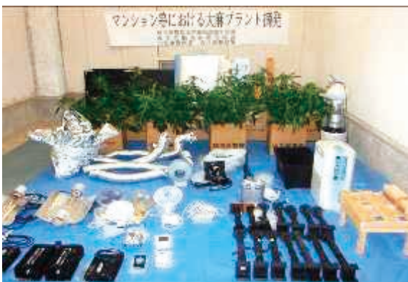
【大麻栽培プラントの摘発】