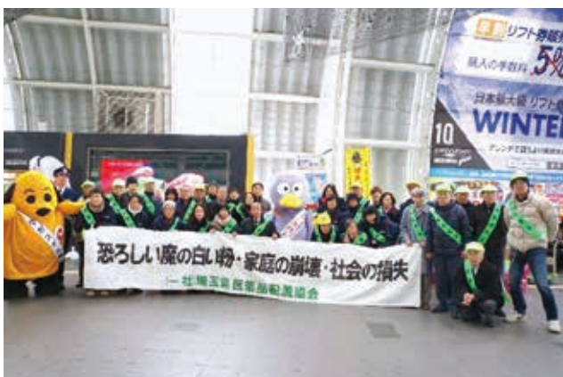
(平成30年1月8日 JRさいたま新都心駅自由通路)