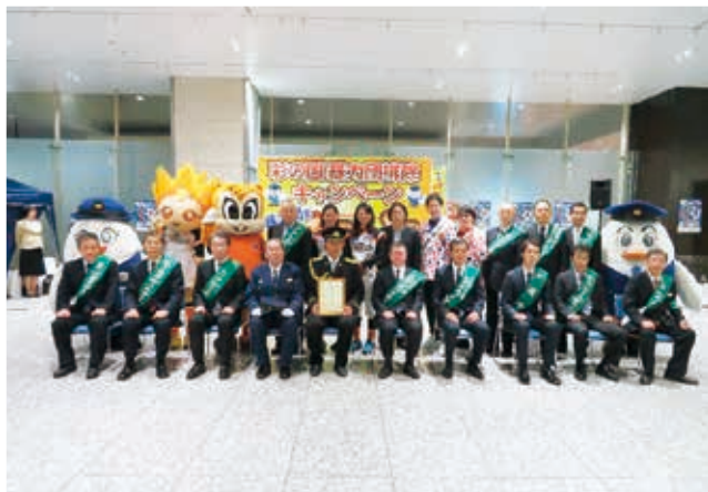
彩の国暴力団排除キャンペーン (平成29年11月10日 JR大宮駅コンコース)

暴力団排除活動をより一層推進するために、暴力団排除キャンペーンや各種広報啓発活動を実施し、県民の暴力団排除意識の高揚を図っています。