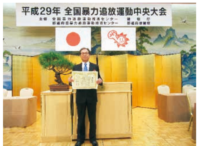
埼玉県自動車販売店暴力対策協議会