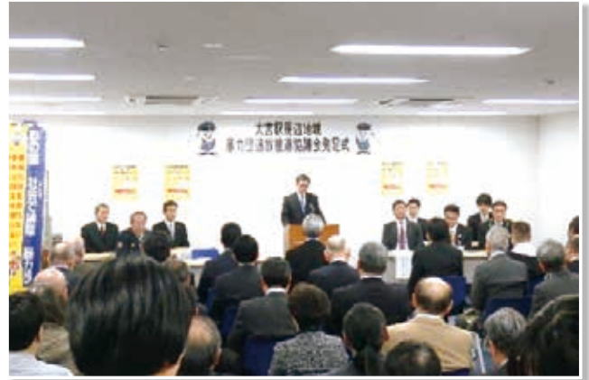
(平成30年3月13日 JR大宮駅会議室)