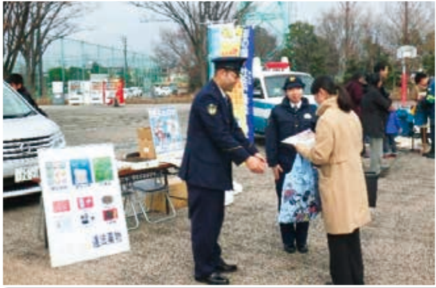
(平成30年1月20日 埼玉スタジアム2002)