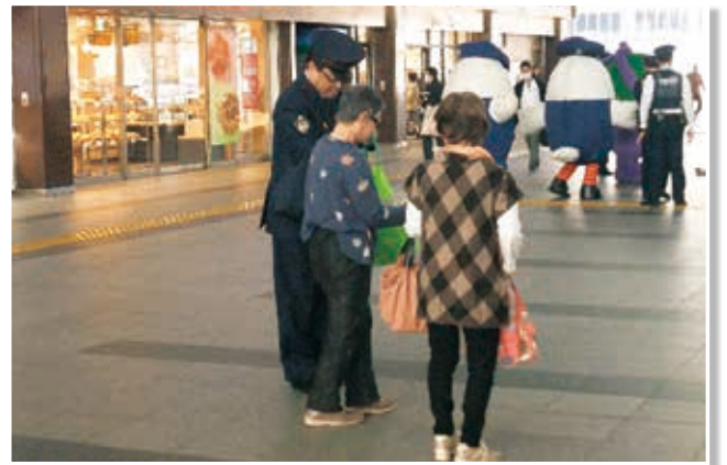
(平成30年3月29日 JR上尾駅コンコース)