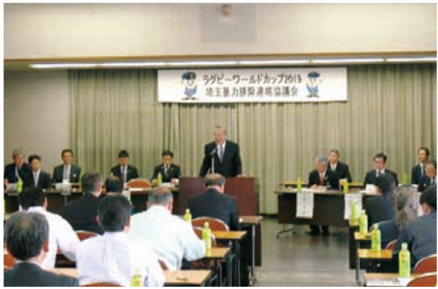
(平成29年4月28日 熊谷商工会議所)