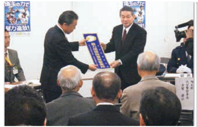
(平成29年11月17日 さいたま市大宮区の大宮駅西口第3-B地区市街地再開発組合会議室)