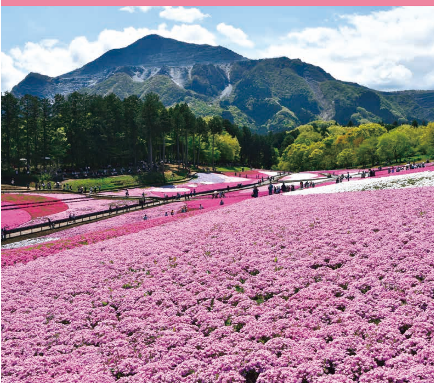
羊山公園芝桜(秩父市)