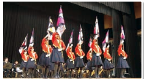
(平成30年1月25日 埼玉会館)